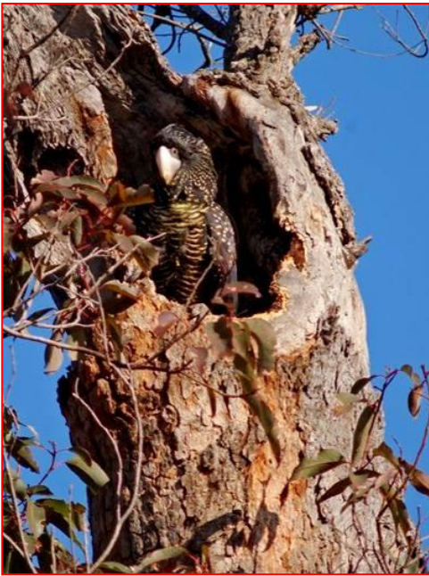
Vrouwelijke Zwarte Roodstaart Bos Kaketoe bij het nest